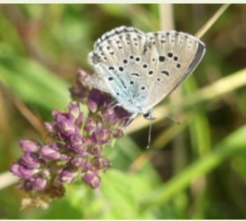
Azuré du serpolet