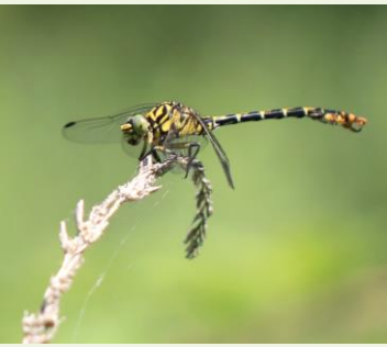
Gompe à pinces

Compte-rendu photos de la visite des 26 & 27 juin 2023