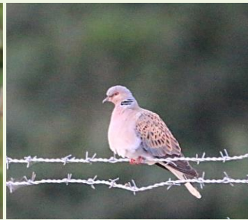
Tourterelle des bois