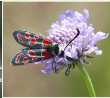
Zygène du sainfoin