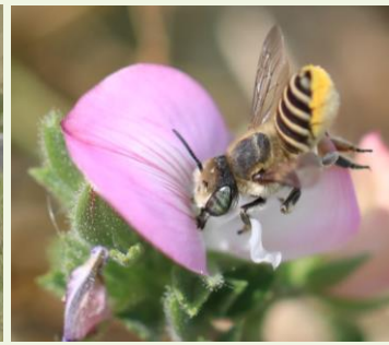
Abeille Megachile sp.